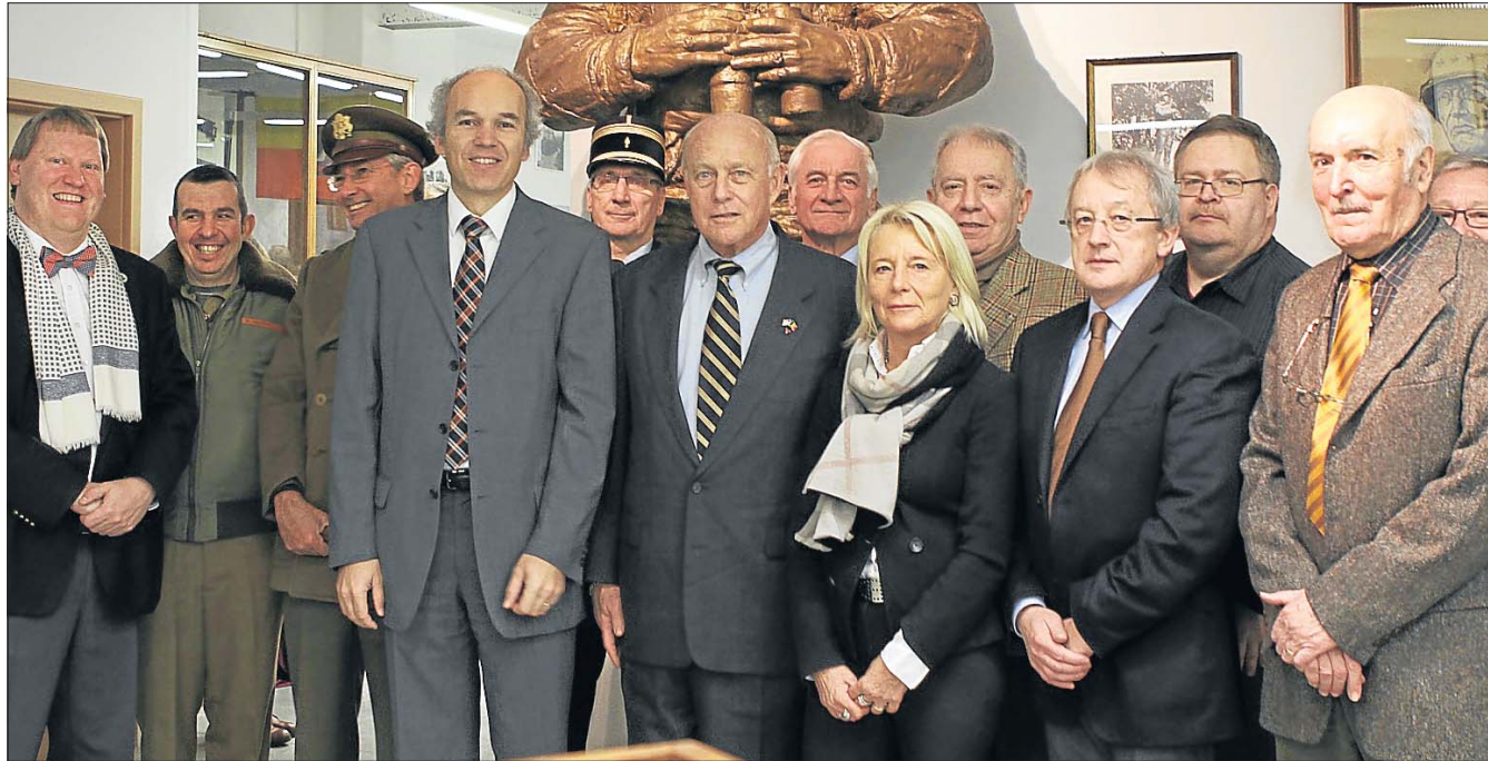
Hoher Besuch im Ettelbrücker „General Patton Memorial Museum“.